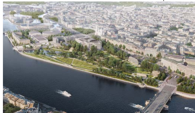
Vue aérienne du site

Différentes fonctions sont éclatées sur le terrain, prises en charge par des architectures de petite échelle. Cette composition décentralisée met en valeur l'idée de promenade. Dans cette vision, Le paysage n'est plus une image figée, mais une suite de mouvements narratifs qui donne vie à l'espace.