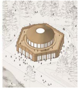
Conception des pavillons qui animent le parc

snow melting and rain drainage, depollution