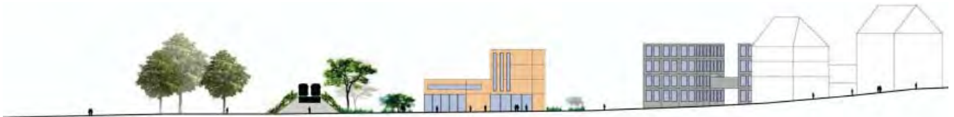
Coupe sur l'entrée principale