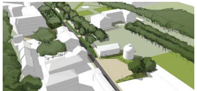
La place du Pigeonnier