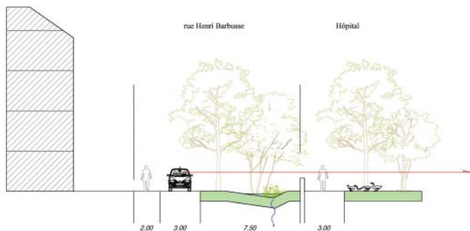
La rue Henri Barbusse