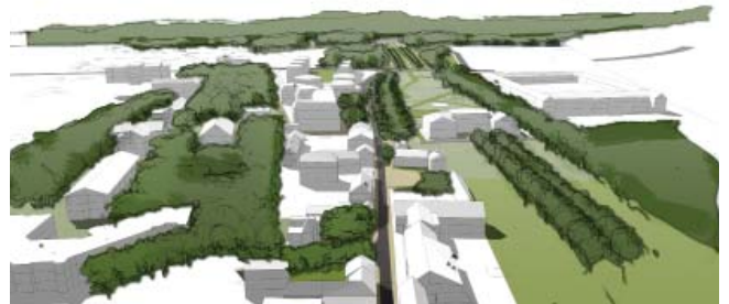
Vue sur la descente de la forêt