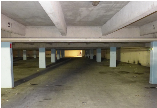
Intérieur du parking R-1