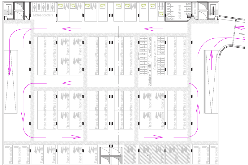
Réouverture R-1 avec diversification des usages: vélos, scooters, bornes IRVE